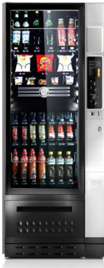
Luce Air Snack